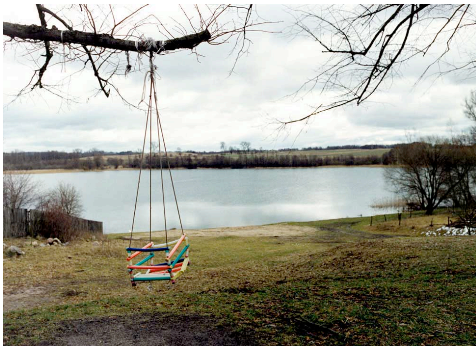
Jessica Backhaus, Lost Summer